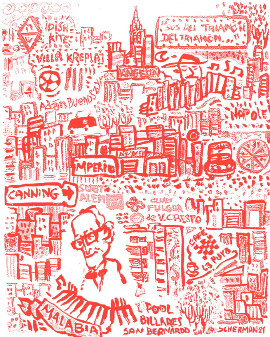
VILLA CRESPO MON AMOUR SEBASTIAN SCHERMAN

PUBLICACIÓN BARRIAL DE DISTRIBUCIÓN GRATUITA MARZO/ ABRIL 2025