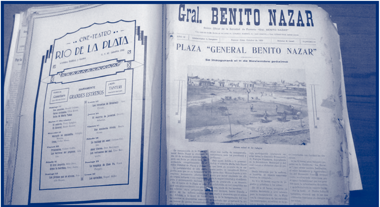
Foto del boletín oficial de la Asoc. Benito Nazar sobre la inauguración de la Plaza Benito Nazar